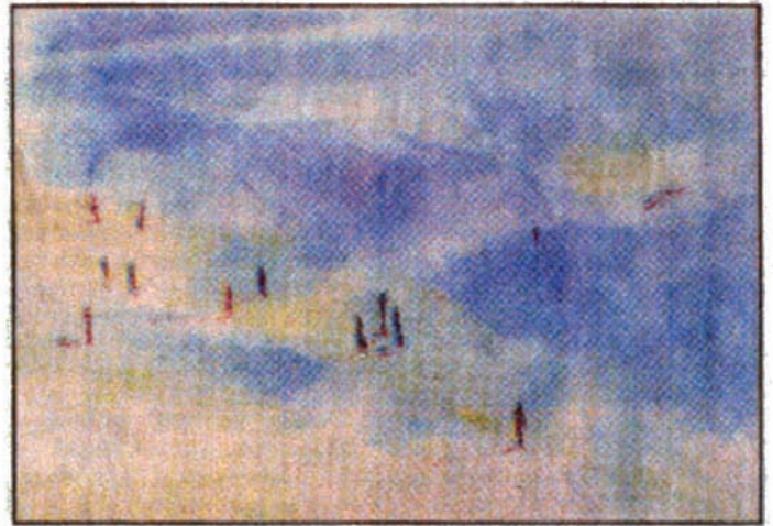
● On the slope, målning av Viktoria Hallenius.